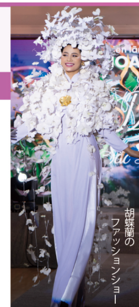
胡蝶蘭のファッションショー

農業資材、スマート農業製品、畜産資材、6次産業化製品が出展し、日本およびアジアから農業関係者が来場。出展企業・来場者間で活発な商談が行われる展示会です。