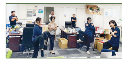
頭も体もしっかりほぐすことができ、すっきりした状態で午後のスタートをされました。