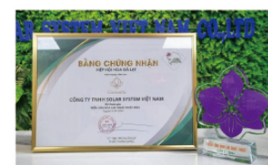
▲主催者表彰されました