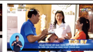
ベトナム全国放送のニュースで紹介されました。