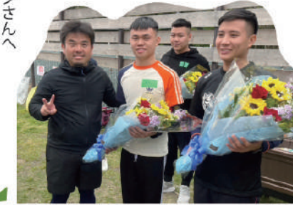
影山代理人からチエンさん・ホップさんへ