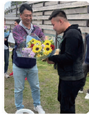
安達代理人からタンさんへ