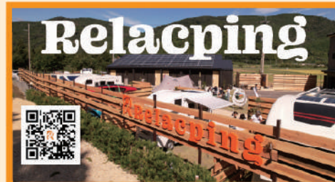
プライベート空間にこだわった新しい形の貸切オートキャンプ場 リラクピング

太陽光発電から蓄電池に貯めたクリーン電力を使用した貸切オートキャンプ場「リラクピング」の運営を行なっています。施設内では、蓄電池で充電可能なレンタルEVバイクのサービスをご提供しており、地域の「プチ観光」が楽しめます。「自転車より遠く、車より近く」を観光テーマに地方創生にも貢献していきたいです。