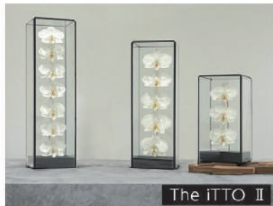
The iTTO II

優れたデザイン、機能ストーリーある製品が一堂に出展し、 全国から約 5 万名が来場する、その時代の"ライフスタイル" を発信する商談展。出展社と多数の来場バイヤーとの間で活発 に取引・商談が行われます。